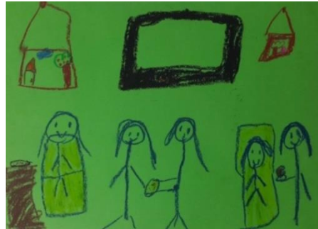
Örnek Resim 1. K2 öğrencisinin “Misafirlerimiz Var” alt temalı resmi

10 katılımcı çocuğun 3'er resminden toplam 30 resmine yer vermenin kapsam gereği zorluğundan hareketle, aşağıda her alt temaya ait yaptırılan resimlerden sadece 1 kız ve 1 erkek çocuğun resimlerine, genel bulgular dikkate alınarak yer verilmiştir.