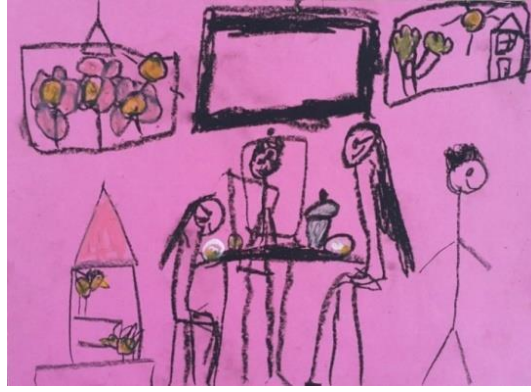
Örnek Resim 3. K5 öğrencisinin “Ailece Yemekteyiz” alt temalı resmi

göstereninin göstergesi olarak, yakın çevre ile birliktelik, eğlence ve sohbet-muhabbet gösterilmek istenmiştir. Resimlerde mekân göstereni olarak çocukların %80'i 'yaşam' ve aileleri ile yemek yedikleri alan olarak 'ev' göstergesini resmetmiştir. Bu bulgunun nedeni olarak, samimi duygularının yaşandığı ve içtenliğin ön planda olduğu bir yer olarak evi düşündükleri söylenebilir. Çocuk için evin önemi büyüktür. Ev, çocuğun gözünde güvenliğin, birlikteliğin, içtenliğin bir yansımasıdır. Çocukların resimlerinde çoğunlukla yemeğe beraber oturdukları insan göstereniyle birliktelik, sevgi, eğlence, bağlılık ve sohbet-muhabbeti gösterilmek istenmiştir. Kullandıkları nesnelere, günlük hayatta her evde bulunan nesnelere, resimleri bütünlemek amaçlı kullanılmıştır. Çocuğun ailesi içinde kabul ettiği kişiler olarak başta çocuğun ebeveynleri olmak üzere, akrabaları, arkadaşları ve öğretmeni de yer almıştır. Öğretmenini de aile bireylerinin içerisinde alması, okulun da bir aile gibi görünmesinin bir yansıması olduğunu söylemek mümkündür.