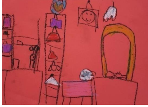
Örnek Resim 5. K5 öğrencisinin “Benim Güzel Odam” alt temalı resmi