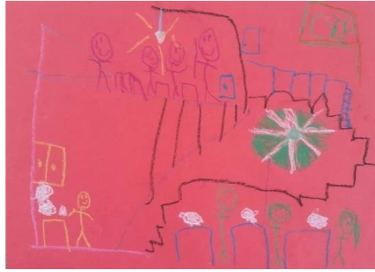
Örnek Resim 4. E3 öğrencisinin “Ailece Yemekteyiz” alt temalı resmi

Tablo 5’e ilişkin olarak; K5 öğrencisi resminde, soldaki kafeste bulunan kuşlar, hayvan sevgisinin olduğu bir ailede yaşadığını gösteriyor. Aile fertlerinin beraber aynı masa etrafında toplanıp yemek yemelerinden duydukları birlikteliği, mutluluğu; yüzlerindeki ifadelerden anlayabiliyoruz. Konuya ilişkin olarak, çocuk; aile fertleriyle beraber geçirdikleri mutlu sabah kahvaltısını resmetmiştir.