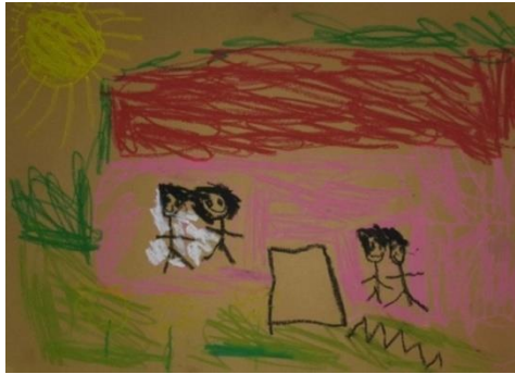
Örnek Resim 2. E5 öğrencisinin “Misafirlerimiz Var” alt temalı resmi

Tablo 2’ye ilişkin olarak; K2 öğrencisi resminde; ağırlama kültürünü, aile fertlerinin hepsinin evde olduğu bir zamanda gelen misafirlere sunduğu ikramlarda göstermiştir. Aksi takdirde ayıplanacağını düşünerek bu durumu resminde sergilemiştir. Ayrıca gelen misafirlerin çocuklarının da olduğu zamanlar, ev sahipliği yapan çocuğun, yalnız kalmayacağı için mutlu olduğunu yapılan görüşmede dile getirmiştir.